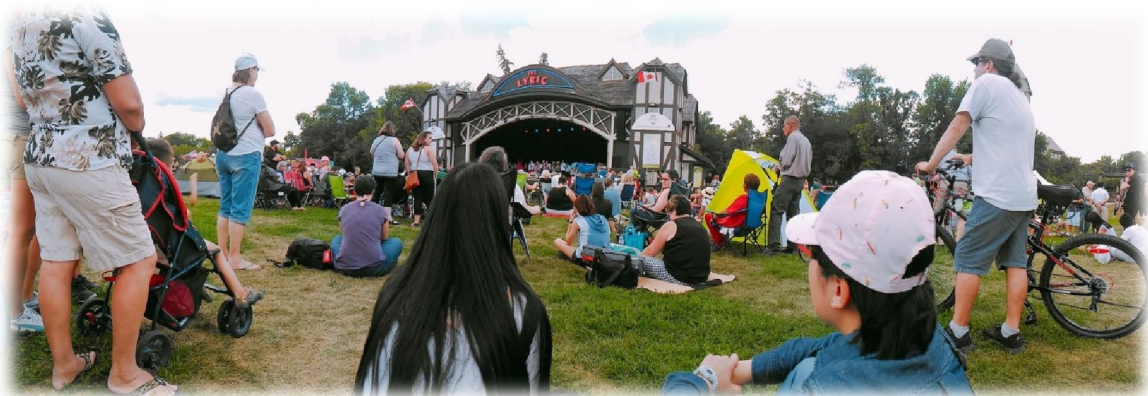
圖(十四) Assiniboine Park

Assiniboine Park 常常會舉辦活動如慶祝 Canada day 的表演、Folklorama 的開幕式表演，甚是還會有露天的電影可以看，而在公園附近還有英式花園(English garden)、兒童花園等美麗的風景可以欣賞，因此多次走訪此地，留下很多美好的回憶。