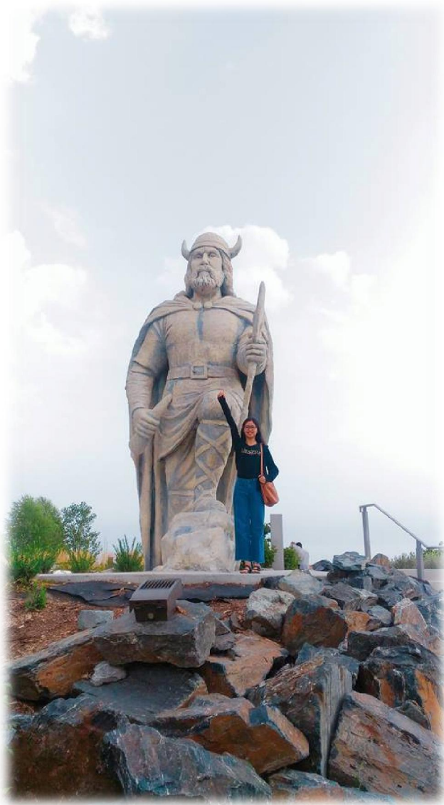
圖(十五) 冰島的象徵-維京人