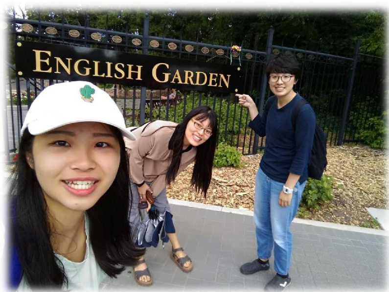
圖(十一) English garden