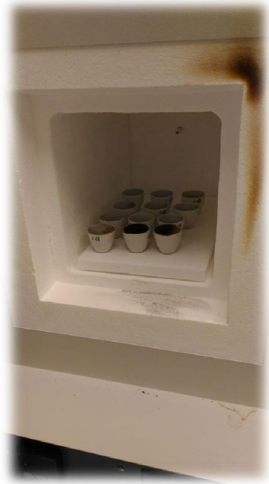
圖(二)(三)：一般成分分析