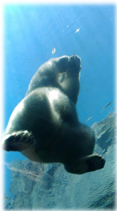
圖(十二) Assiniboine Park Zoo 中最受歡迎的動物-北極熊