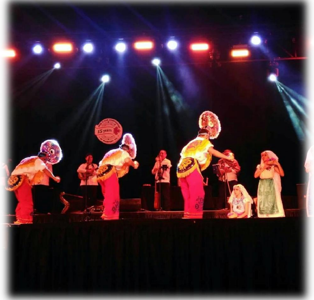
圖(九)(十) Mexican Pavilion 舞者表演照片