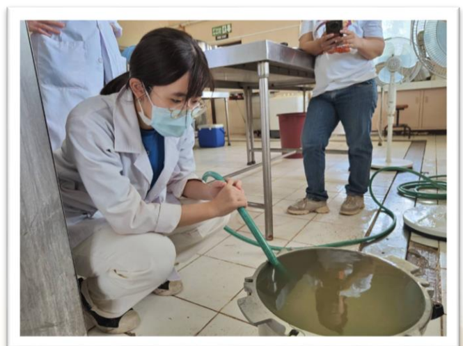
▲流水冷卻經脫氣過後的罐頭

第四個實習地點是到海鮮加工廠實習，因剛好遇到菲律賓的節慶連假與全體 IFPT 職員出差，故實習天數只有兩天。研究主題為醃漬與煙燻鮭魚。這也是我第一次見到煙燻的機器並且實際看到煙燻的過程，很新奇！