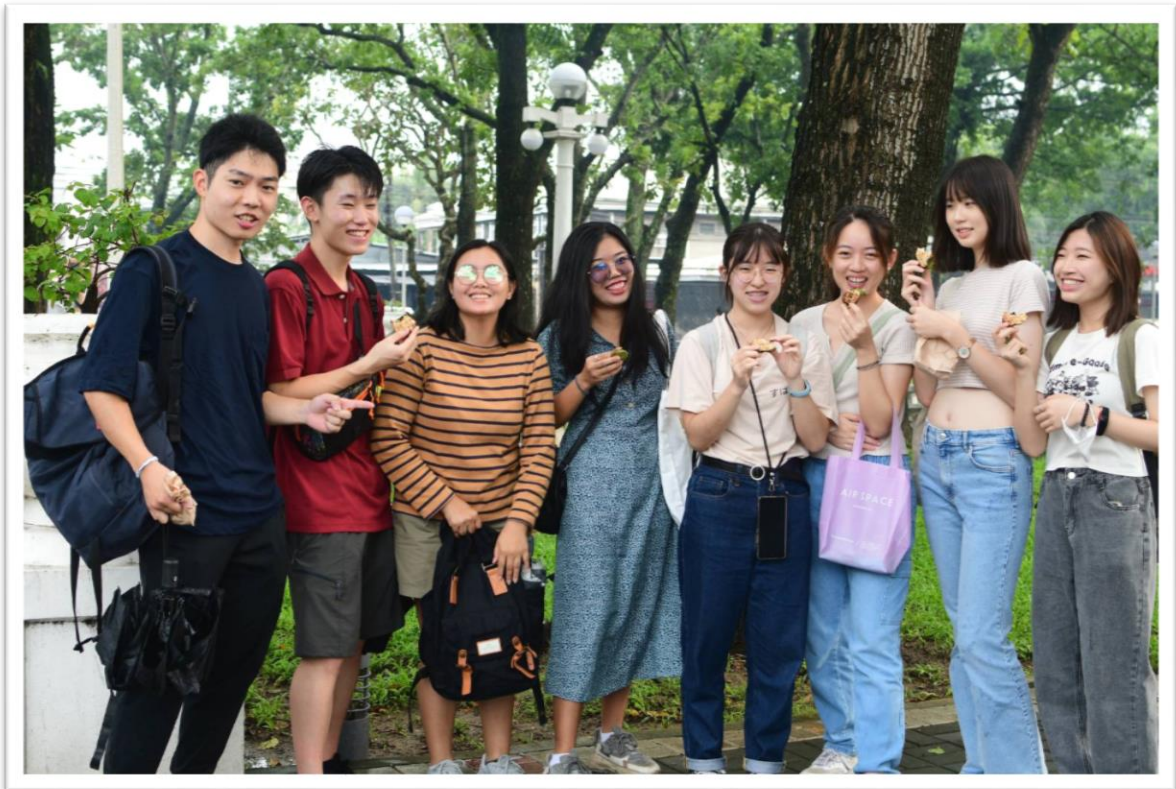
▲與來自日本鹿兒島大學與菲律賓大學的學生一起嘗試當地傳統美食 Bibingka

在實習的兩個月內，我們總共去了水產加工技術研究所中四間不同的實驗室與區域研究中心實習。根據每間實驗室所擁有計畫我們做了各種不同主題的研究。每個主題都有學習到很多新知識，並接觸到以前沒有實際看過的設備與樣品。也從中了解了部分臺灣大學實驗室與我們所實習的菲律賓大學實驗室的差異。其最大的差異在於我們所接觸到的菲律賓大學實驗室飲食的地方與實驗室是分開的，實驗室就是擺放儀器與設備，飲食的部分要到感官品評室或是去學生餐廳用餐，大部分的學生沒有自己的辦公桌，所以也無法在自己的座位上用餐。在實習的過程中，我們也常與當地學生進行文化交流，從歷史上到語言上，我們互相教導對方了一些基本的菲律賓語 (Tagalog) 與中文會話。從中也讓我深深感受到回國後應該將臺灣歷史好好再複習一次，這樣在向外國人介紹我們的文化與地方特色時，他們比較能夠理解。