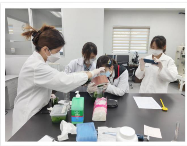
▲與 FFFNL 的職員一起進行樣品前製備