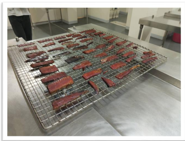
▲經煙燻後的鮭魚肉

最後一周是到海鮮加工實驗室實習，恰巧那週也有菲律賓的節慶連假，所以也只有實習兩天。這兩天我們在學習製作藻類義大利麵與沙丁魚罐頭。