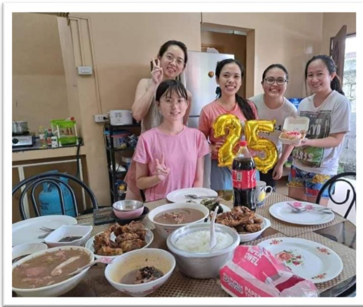
▲與隔壁房的房客一起慶祝其他房客的生日

此次住宿的地點是位於菲律賓大學米莎鄔分校附近的 Boarding House。這間 Boarding House 的房客皆為女性，大部分是菲律賓大學米莎鄔分校的學生，其中也有部分是老師與附近其他大學的學生。菲律賓也有著大家聚在一起過生日的習俗，在這實習的兩個月，我們一起度過了其中一位赴菲律賓實習同學的生日以及隔壁房房客的生日，也因此認識了其他房的房客，交了許多菲律賓的朋友，很有趣！