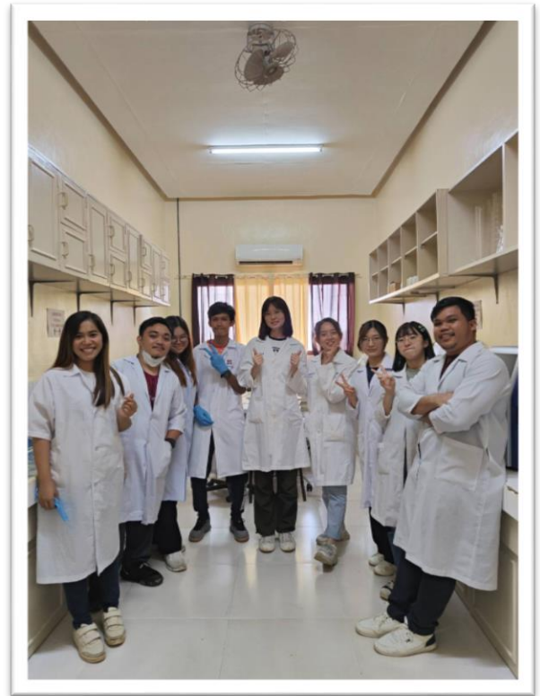
▲與有機化學實驗室的同學們以及同樣來此實驗室實習的菲律賓高中的學生們的合照

接下來是到區域研究中心裡的食物、飼料與機能性營養實驗室 (Food, Feed, & Functional Nutrition Laboratory, FFFNL) 實習一週。我們參觀了許多新型的儀器與設備，例如測定油脂酸敗與基因定序的儀器.....等。但由於中心才剛落成，一些研究中心中的實驗室尚未搬到最新的研究大樓中，所以我們只有參觀部分實驗室。在這一週中，我們進行了藻類的顯微鏡下計數、強制通風乾燥 (Forced Air Drying)、冷凍乾燥、噴霧乾燥、菌數培養，以及油脂酸敗測定等實驗。