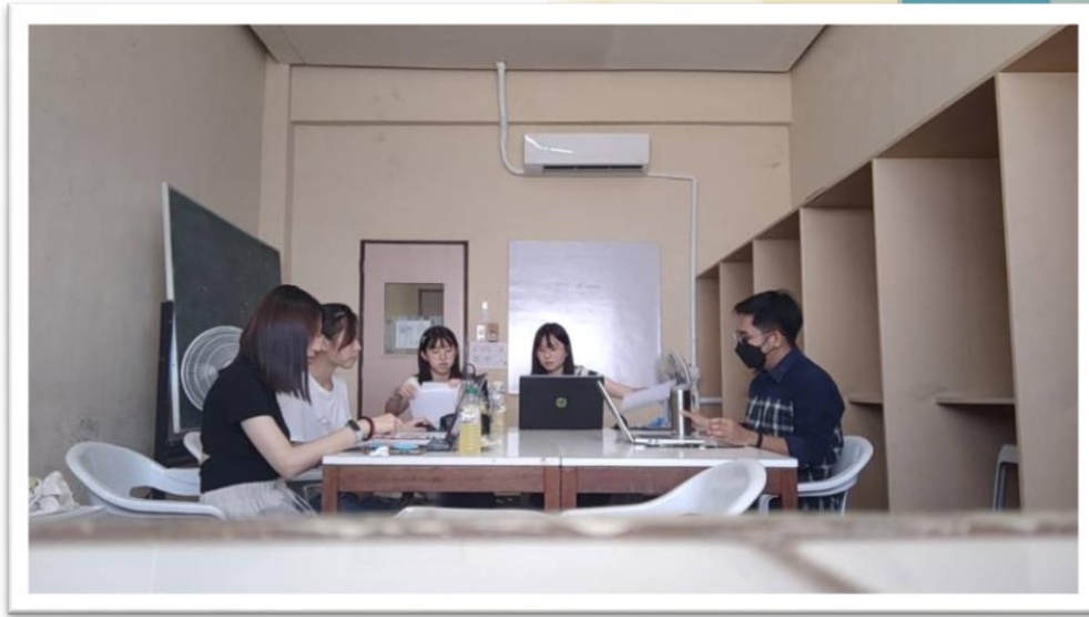
▲與研發實驗室的同學討論成本的計算

第三個實習地點是到研究與開發實驗室實習一週。研究主題為創新海鮮製品的加工流程標準化與市場分析。研究內容為製作生物可分解塑膠膜，並進行其厚度、溶解率與製程成本的分析。