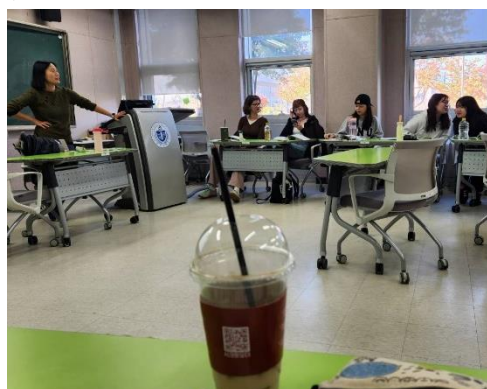
▲三級韓文班上課情形。