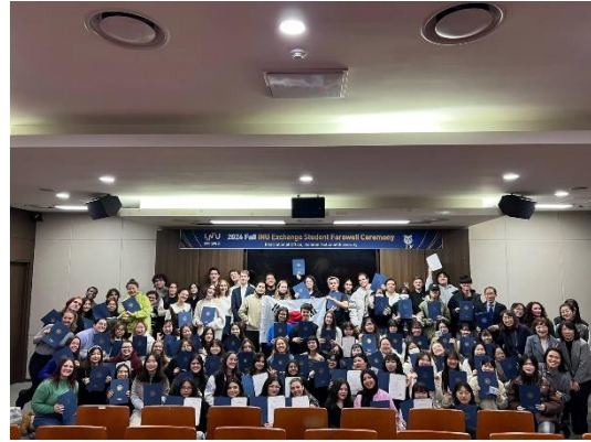
▲交換學生學期結業式。