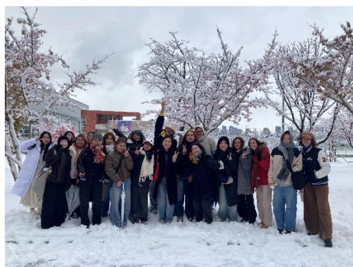
▲初雪時，與三級韓文班的教授和同學一起在積雪的校園合照。

仁川大學會提供交換學生專門的韓文課，想學習韓文的學生，學期選課前學校會以線上表單或面試來測試韓文程度，依個人的韓文程度分級，總共有 6 個等級，即使是完全不會韓文也可以從頭開始學習。我在測驗中被分配至 3 級韓文，雖然我持續透過音樂和戲劇學習韓文，但接受系統化學習的時間不長，文法的基礎不足，進入三級對我而言是一項挑戰。3 級韓文分為四堂課，由兩位教授共同授課，課程內容主要分為四部分：文法、單字、會話和寫作，藉由每個章節的主題學習新單字和文法，再應用於會話和寫作，經常需與同學對話或發表。剛開始上課時令我感到最挫折的部分是寫作，因為文法的基礎不佳、單字量不足，寫作需要反覆查閱字典和文法，與其他同學相比速度較慢，且正確度較低。經過多次練習，錯誤的頻率下降，與初期相比可以透過韓文更準確的表達自己的想法！