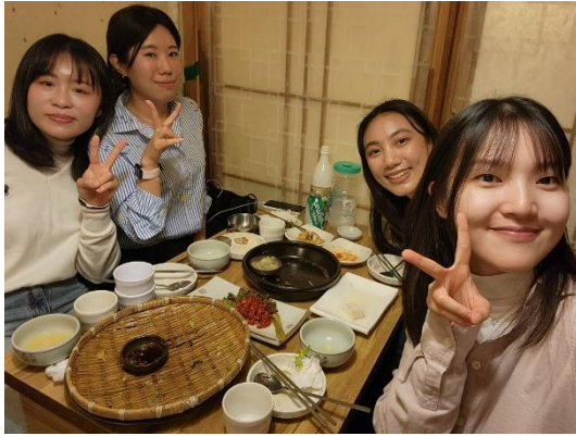
▲與韓國學伴品嚐道地韓國煎餅、豆腐泡菜和馬格利酒。