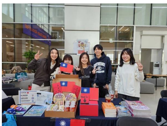
▲ Global fair 的臺灣攤位，藉此機會讓其他國家的同學認識臺灣和自己的學校。

若有同學有出國交換的理想，卻因為各種顧慮而裹足不前，我想鼓勵大家勇敢嘗試，把握機會去探索更廣闊的世界。