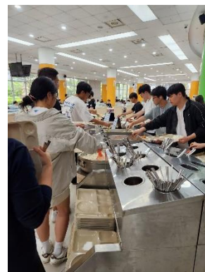
▲仁川大學校園：校園一隅 (左)、學生圖書館 (中)、學生餐廳 (右)。