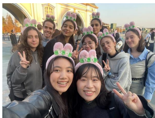
▲ 國際處舉辦之韓文文化體驗活動，在愛寶樂園與西班牙同學們合照。