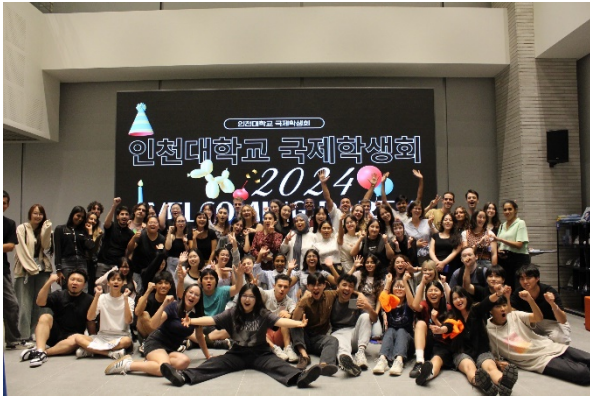
校內社團 ISSC 舉辦之歡迎會