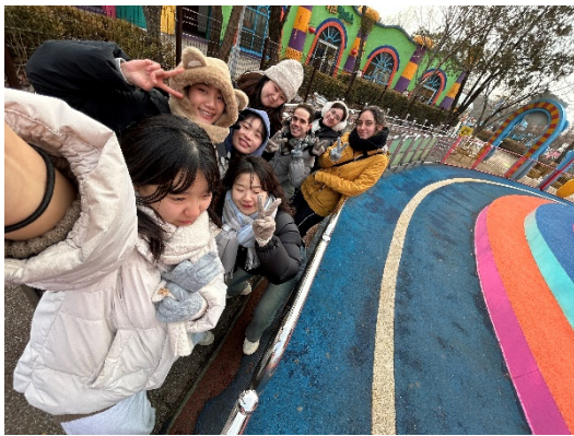
Korean Cultural Experience - Seoul Land