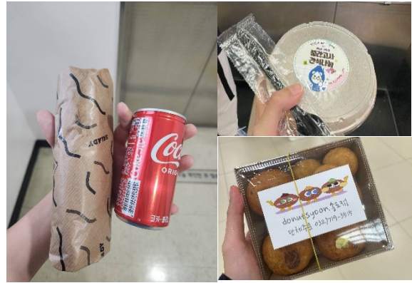
學校和宿舍期中期末溫馨餐點